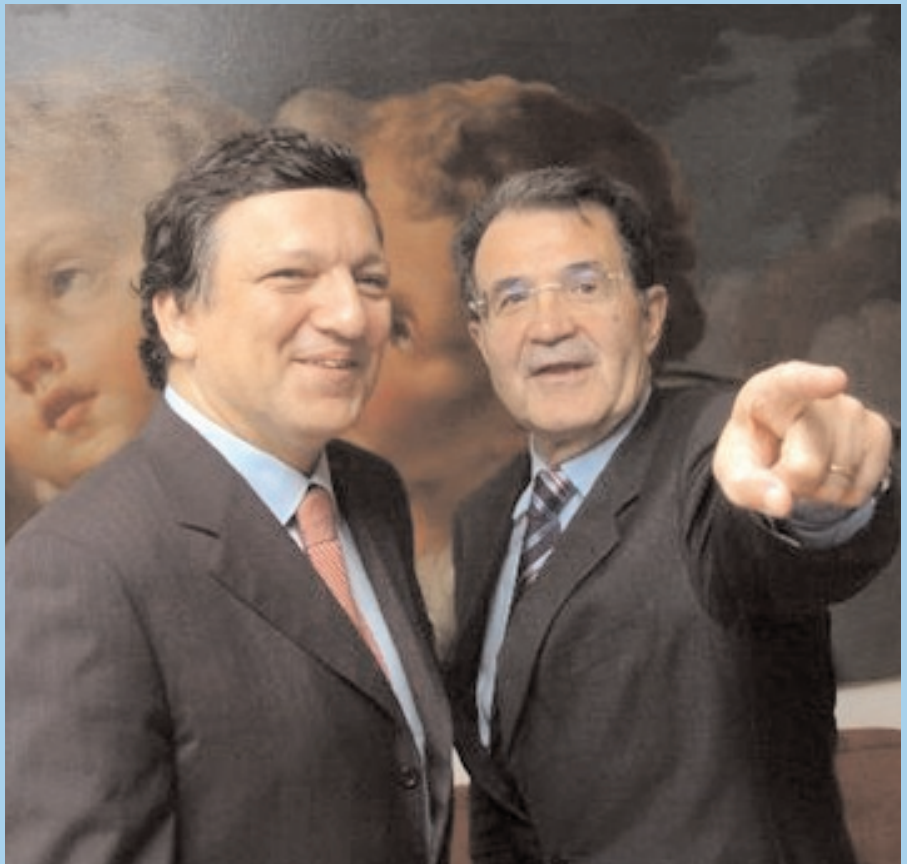
I november tar José Barroso over som formann for Europakommisjonen etter Romano Prodi

Grunnloven åpner også opp for at en gruppe land kan utvikle nærmere samarbeid seg imellom. Andre medlemsland vil ifølge denne ordningen ha muligheten til å ta del i samarbeidet på et senere tidspunkt. På flere områder vil EUs medlemsland beholde muligheten til å stanse et forslag. Enstemmighet vil fortsatt gjelde for skattepolitikk og en rekke områder innen utenriks-, sikkerhets- og forsvarspolitik, samt i eventuelle endringer av Grunnloven.