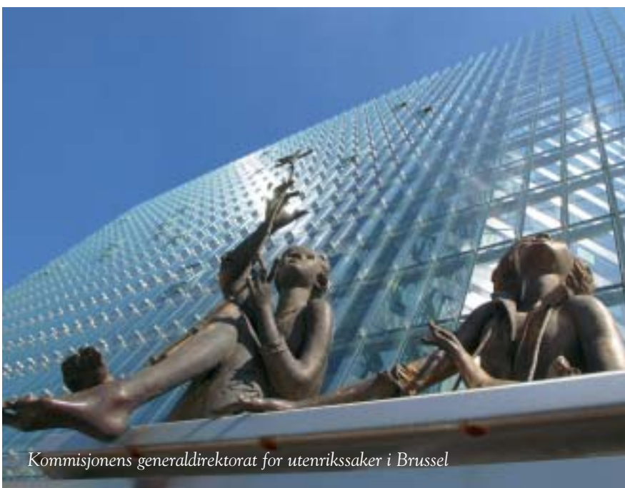
Kommisjonens generaldirektorat for utenrikssaker i Brussel

Etter høstens suksess planlegger Delegasjonen et kurs om EU/EØS for journalister. Kurset vil gå over 4-5 dager, og skal holdes i Oslo og Brussel i mai og juni. Høgskolen i Oslo er samarbeidspartner i prosjektet. Informasjon og invitasjon vil blant annet bli sendt ut via vårt elektroniske nyhetsbrev «EU-nytt» om kort tid.