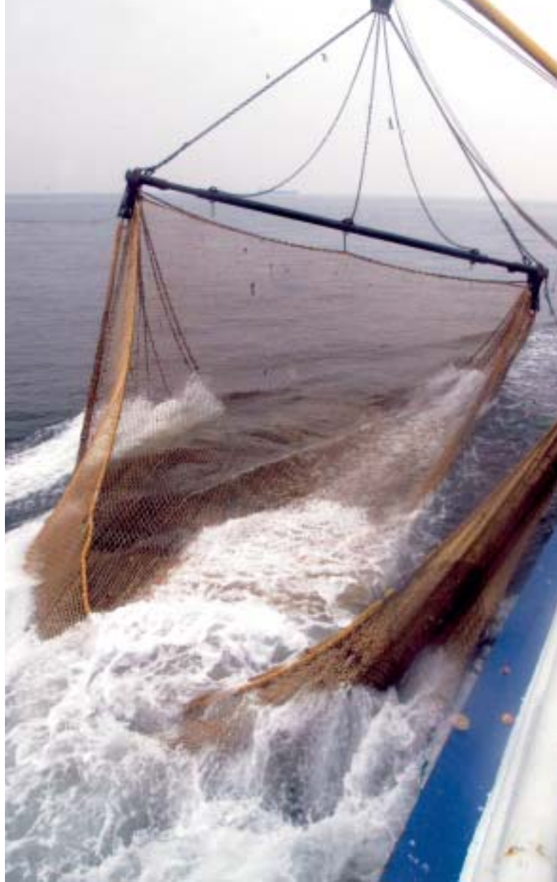
Bærekraftig utvikling og strengere kontroll er viktige elementer i reformen av EUs felles fiskeripolitikk

inspeksjonsmekanismene styrkes, vil også berørte de av reformen, fiskere og andre interessegrupper, bli tatt med i beslutningsprosessene gjennom etableringen av regionale rådgivende råd.