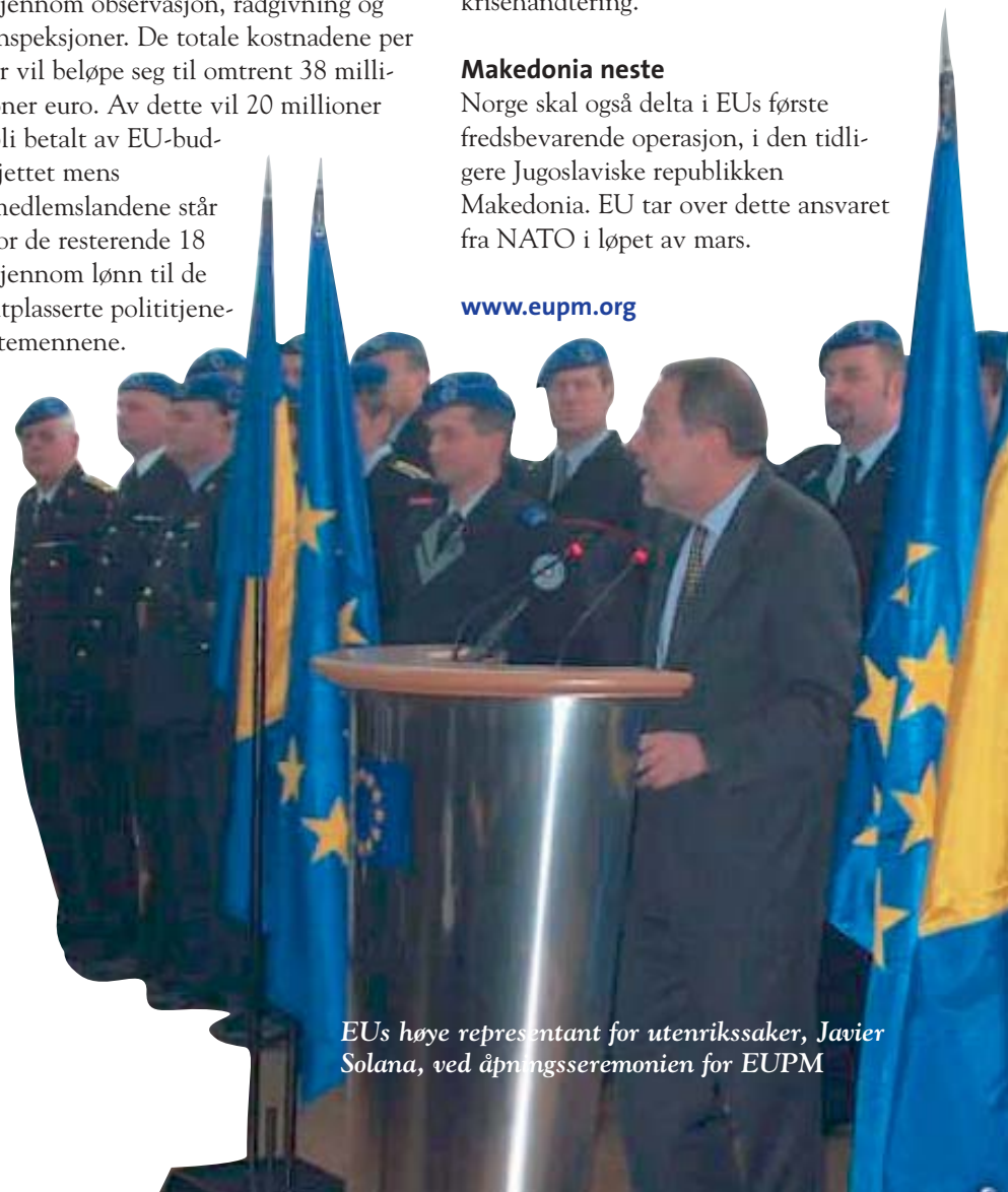
EUs høye representant for utenriksaker, Javier Solana, ved åpningsseremonien for EUPM